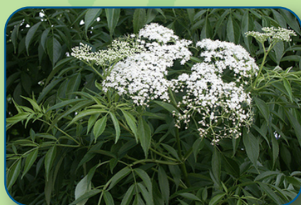
Sureau du Canada