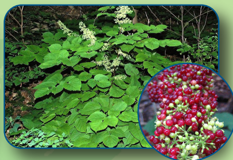
Aralie à grappes