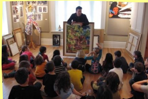
Maison Louise Carrier