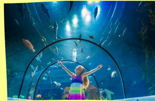
Aquarium du Québec