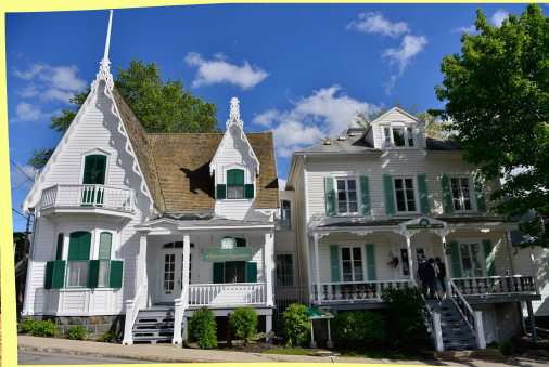
Maison Alphonse Desjardins