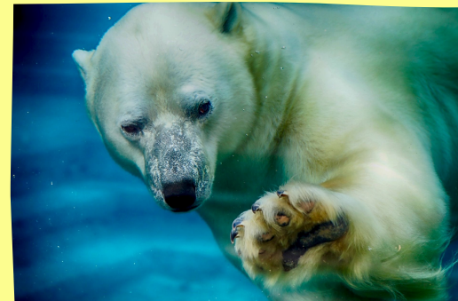
Aquarium du Québec