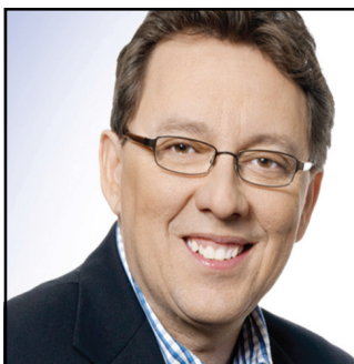
Jean D'Amour Député de Rivière-du-Loup

Bureau de Trois-Pistoles 4-400, rue Jean-Rioux 418 851-1748